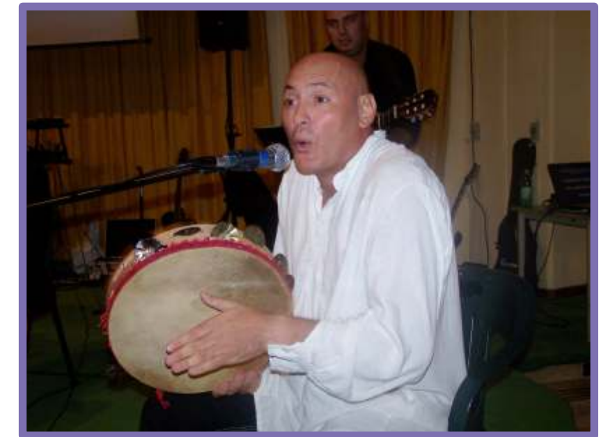
Gli Antichi Cantori